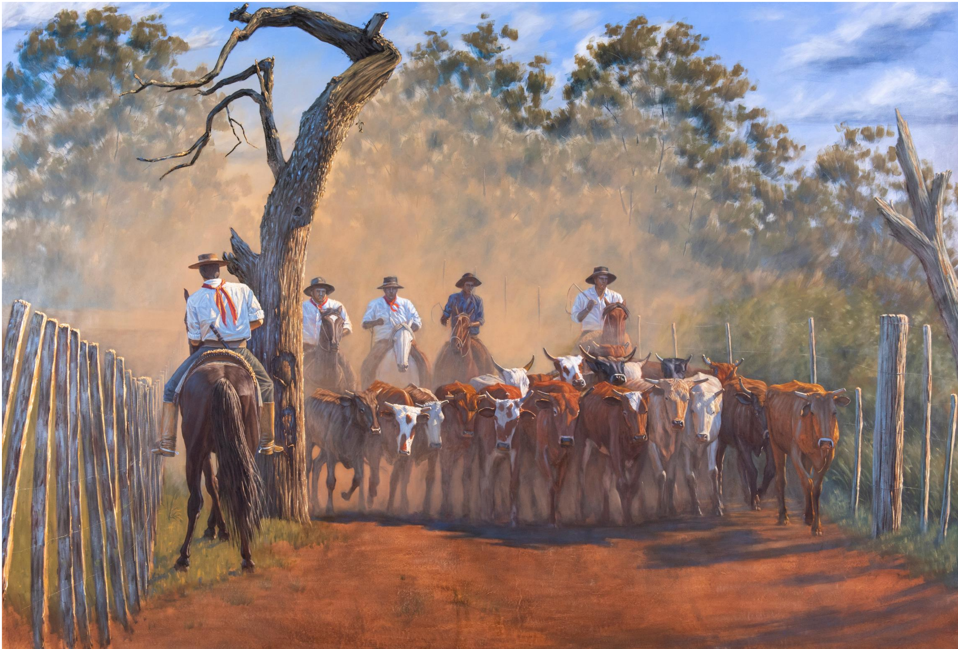
Alejandro Arnutti TOCANDO A BOIADA, 2018 óleo sobre tela 200 x 320 cm