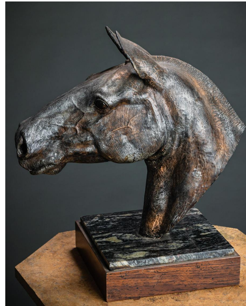
Crioulo Oveiro Colorado 2016 Resina, pastas metálicas e base de madeira e mármore 52 x 35 x 33 cm peça única