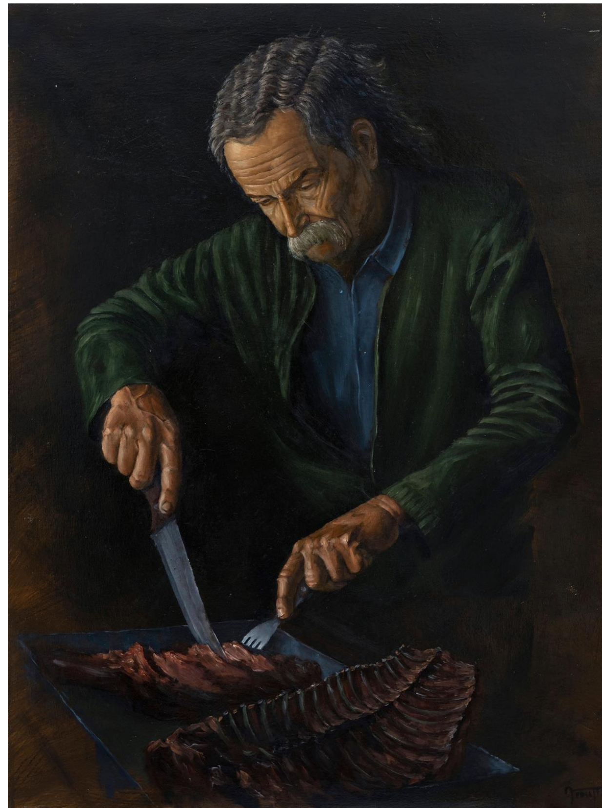
Alejandro Arnutti SERVINDO O ASSADO 2017 [série A Nação Pampa ] óleo sobre tela 70 x 50 cm