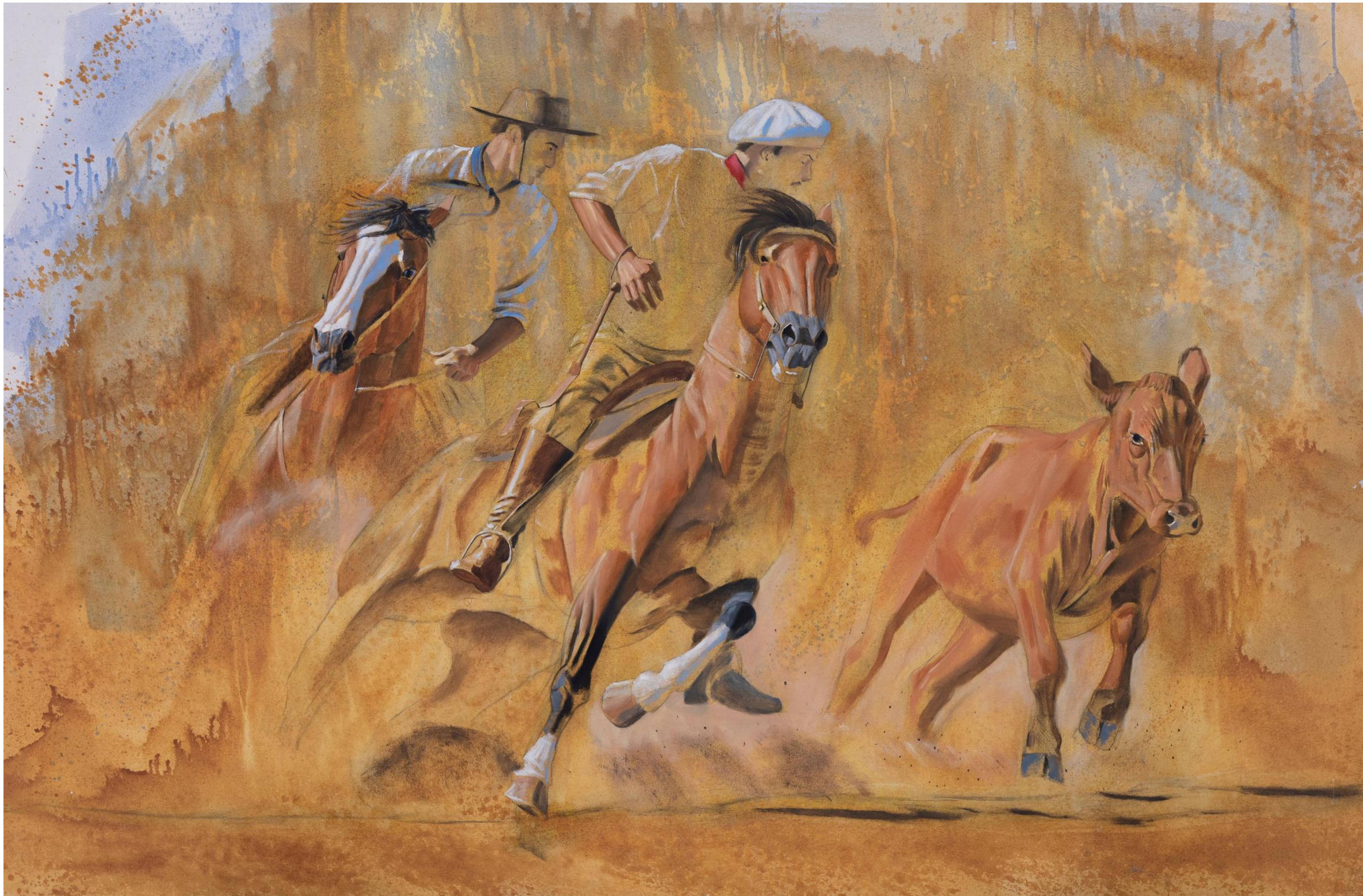
Alejandro Arnutti PALETEADA , 2020 [série Inacabados ] óleo sobre acrílica sobre tela 100 x 150 cm