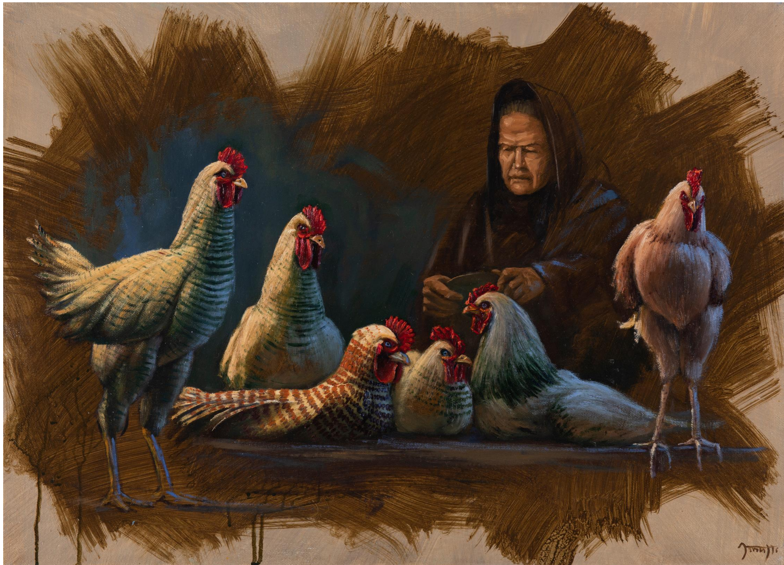
Alejandro Arnutti COLHENDO OVOS , 2017 [série Inacabados ] óleo sobre acrílica sobre tela 50 x 70 cm