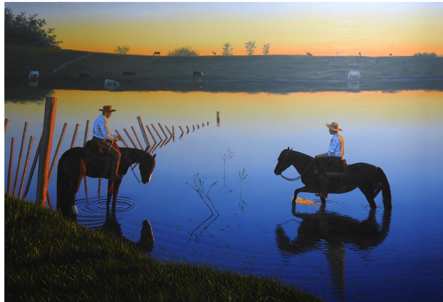
Alejandro Arnutti ENTARDECER 2021 [série A Nação Pampa ] óleo sobre tela 100 x 150 cm