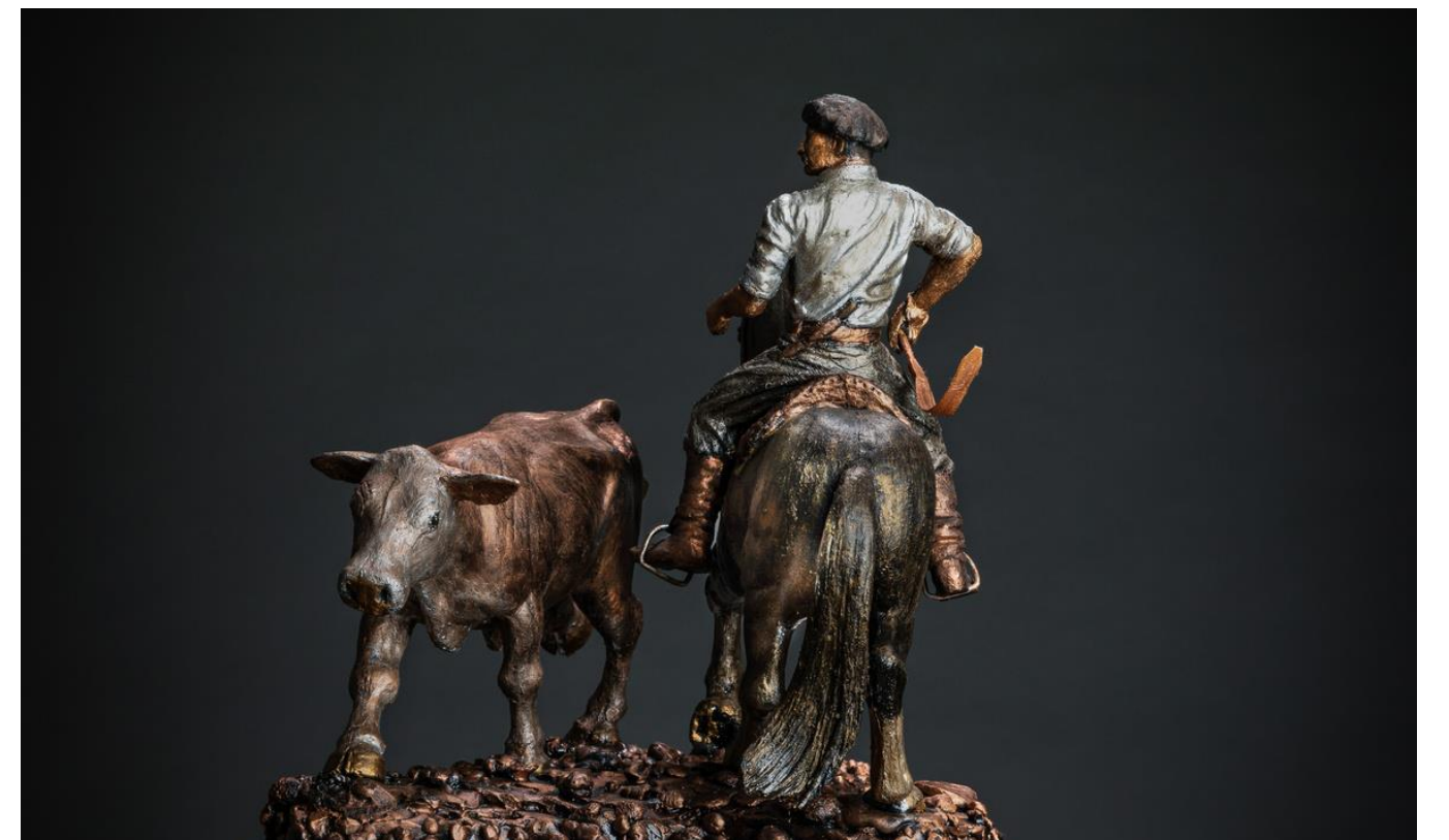
Alejandro Arnutti O Gaúcho, o Cavalu Crioulo e o Gado , 2022 Resina, pastas metálicas e base de madeira 35 x 35 x 36 cm, peça única