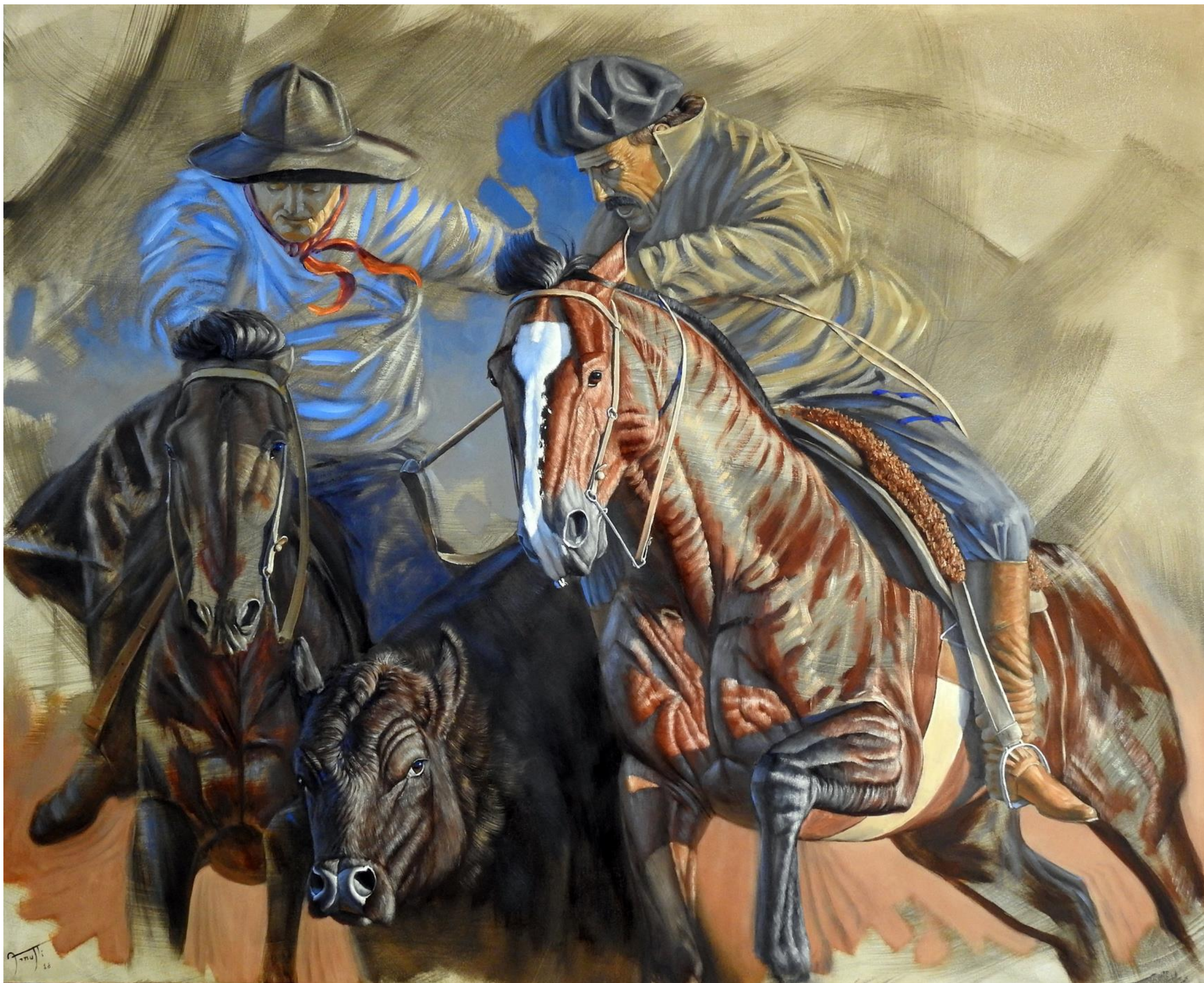
Alejandro Arnutti Rastros de Paleteada , 2018 [série Inacabados ] óleo sobre acrílica sobre tela 125 x 140 cm