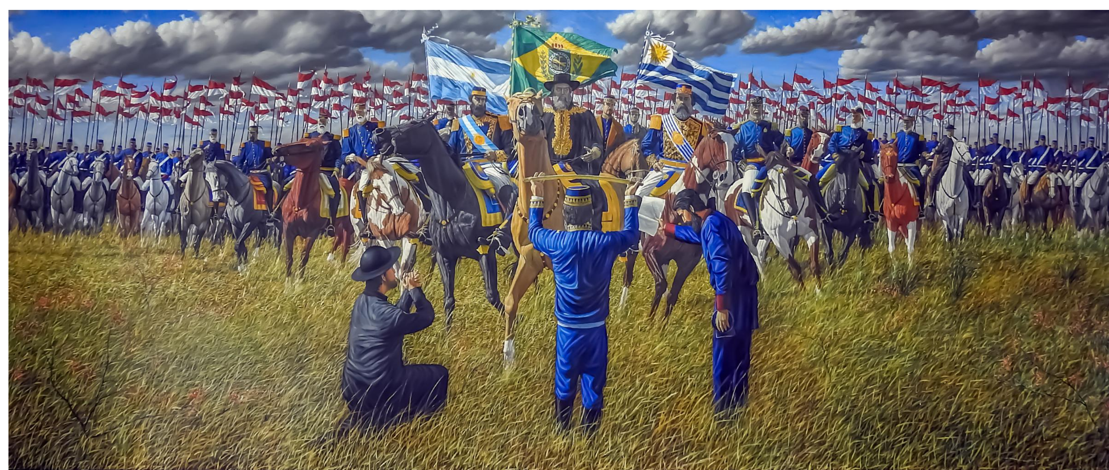
Alejandro Arnutti Retomada de Uruguaiana na Guerra do Paraguai 2014/2015 óleo sobre tela, 305 x 735 cm Acervo da Prefeitura Municipal de Uruguaiana/RS, exposta em forma permanente no seu Salão Nobre