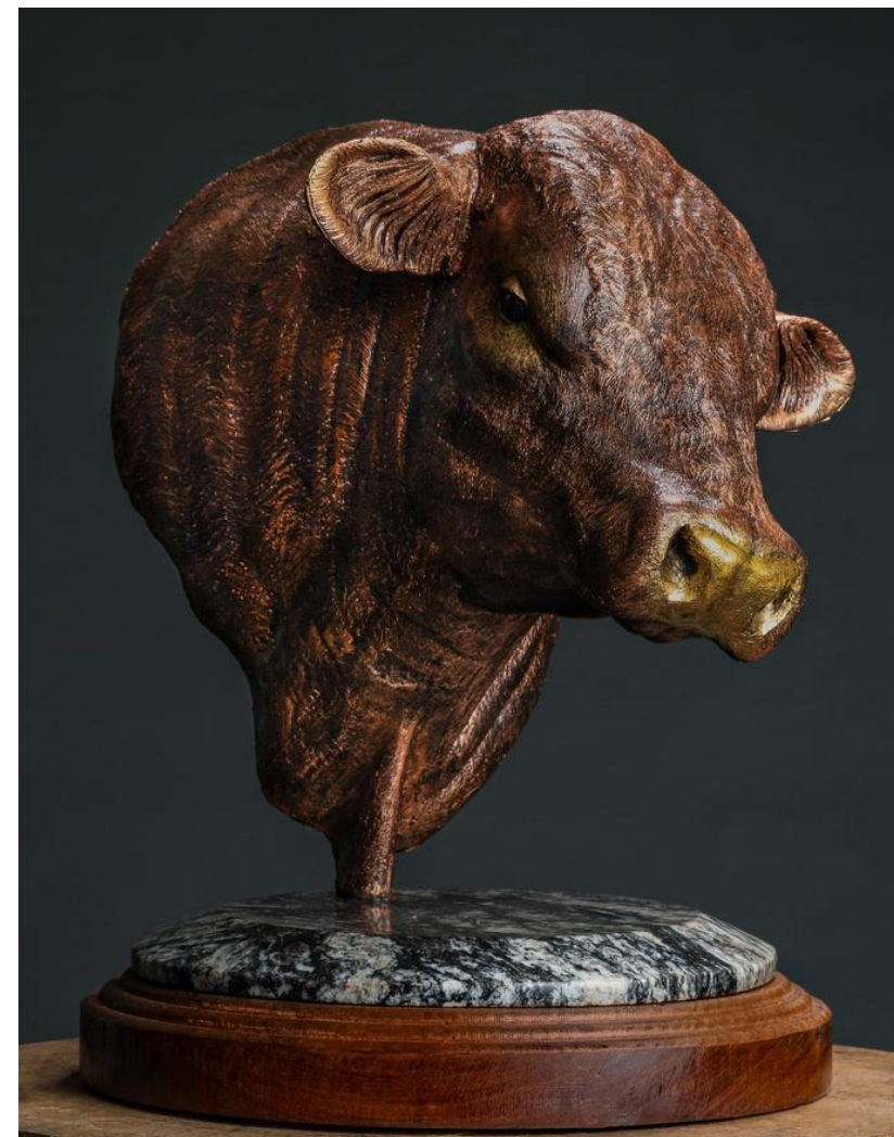
Touro Angus, 2017 Resina, pastas metálicas e base de madeira e mármore 45 x 30 x 30 cm, peça única