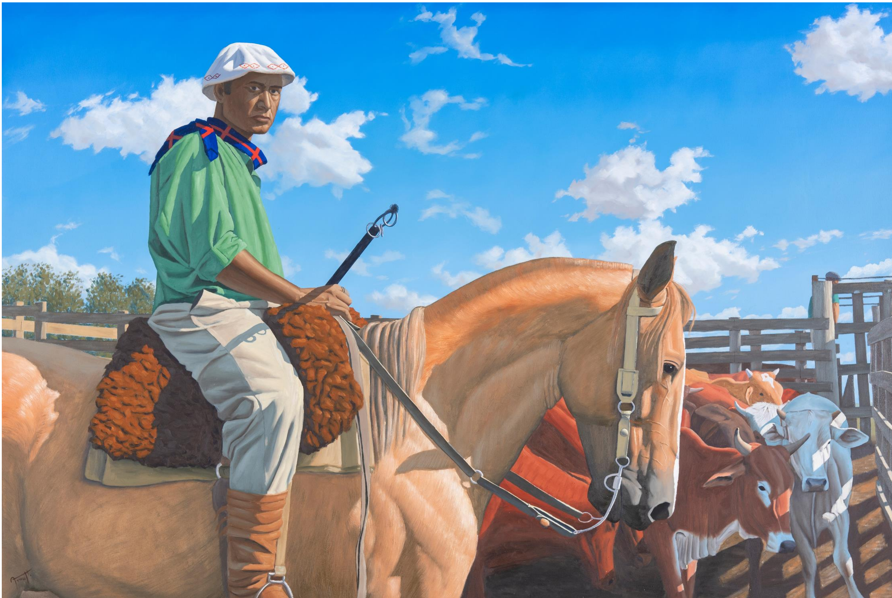
Alejandro Arnutti GAÚCHO NA MANGUEIRA 2021 [série A Nação Pampa ] óleo sobre tela 100 x 150 cm