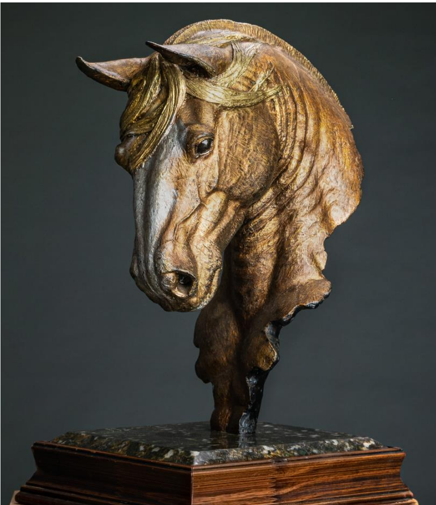
Crioulo Baio Ruano 2019 Resina, pastas metálicas e base de madeira e mármore 57 x 35 x 32 cm, peça única