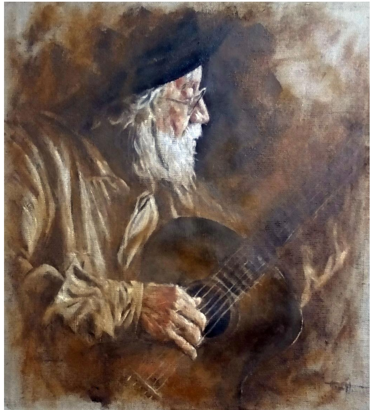
Alejandro Arnutti TELMO DE LIMA FREITAS , 2017 [série Inacabados ] óleo sobre estopa 110 x 100 cm