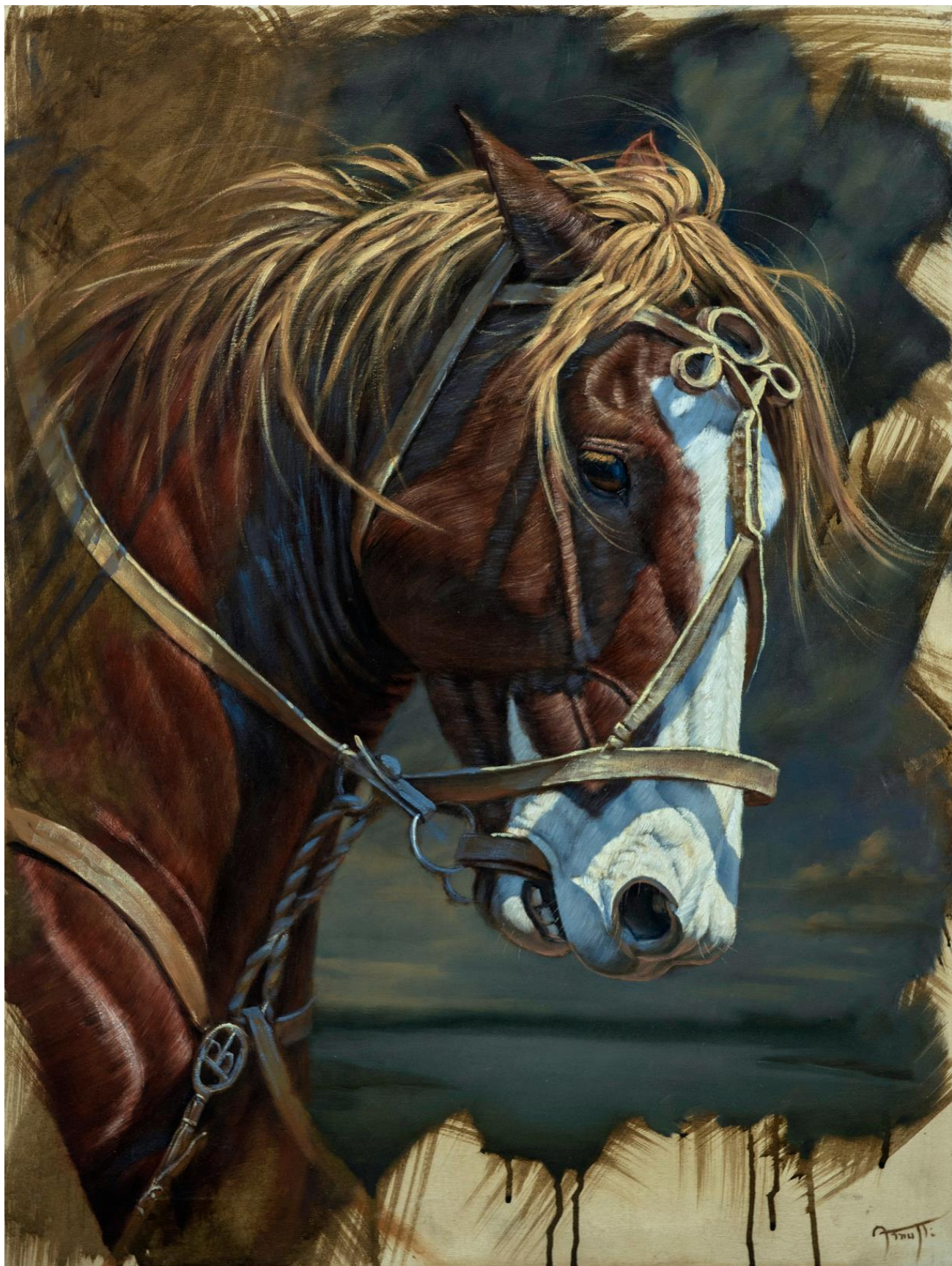
Alejandro Arnutti COLORADO MALACARA , 2017 [série Inacabados ] óleo sobre acrílica sobre tela 80 x 60 cm