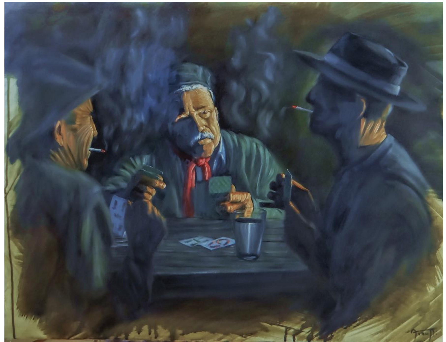
Alejandro Arnutti JOGO DE TRUCO , 2018 [série Inacabados ] óleo sobre acrílica sobre tela 50 x 70 cm