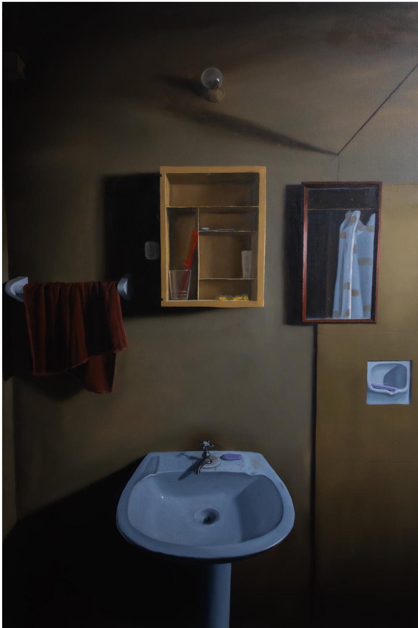
Alejandro Arnutti RECANTO SOLITÁRIO DE UM PAISANO , 2026 [série A solidão da imensidão ] Óleo sobre tela, 120 x 80 cm R$ 7.000,00