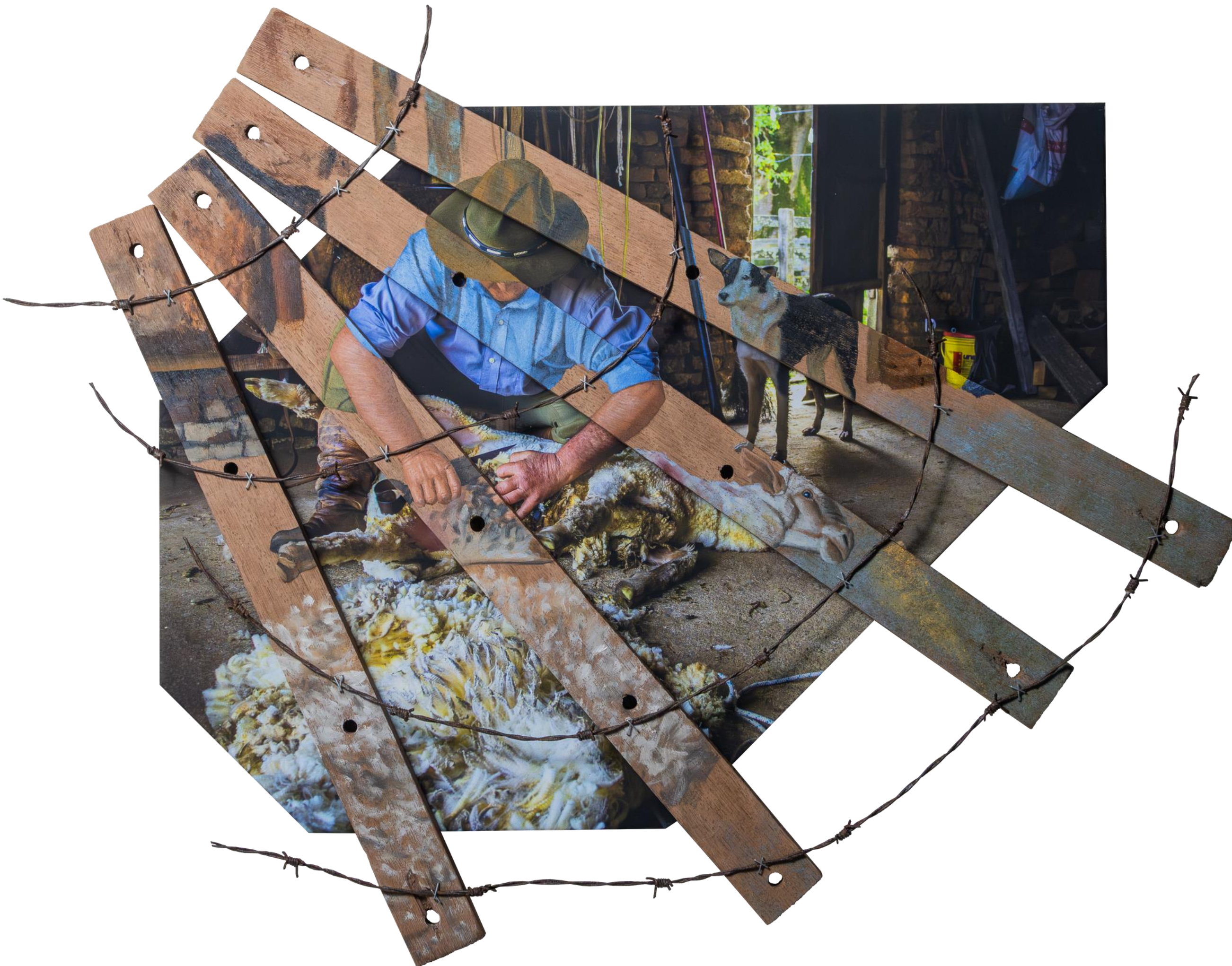
Alejandro Arnutti Entre a Tesoura e o Latido Amigo 2026 [série Os últimos gaúchos ] Assemblagem: impressão em Fine Art sobre tela, pedaços de madeira parcialmente pintados com tinta a óleo e arame farpado. 65x82x4,5 cm