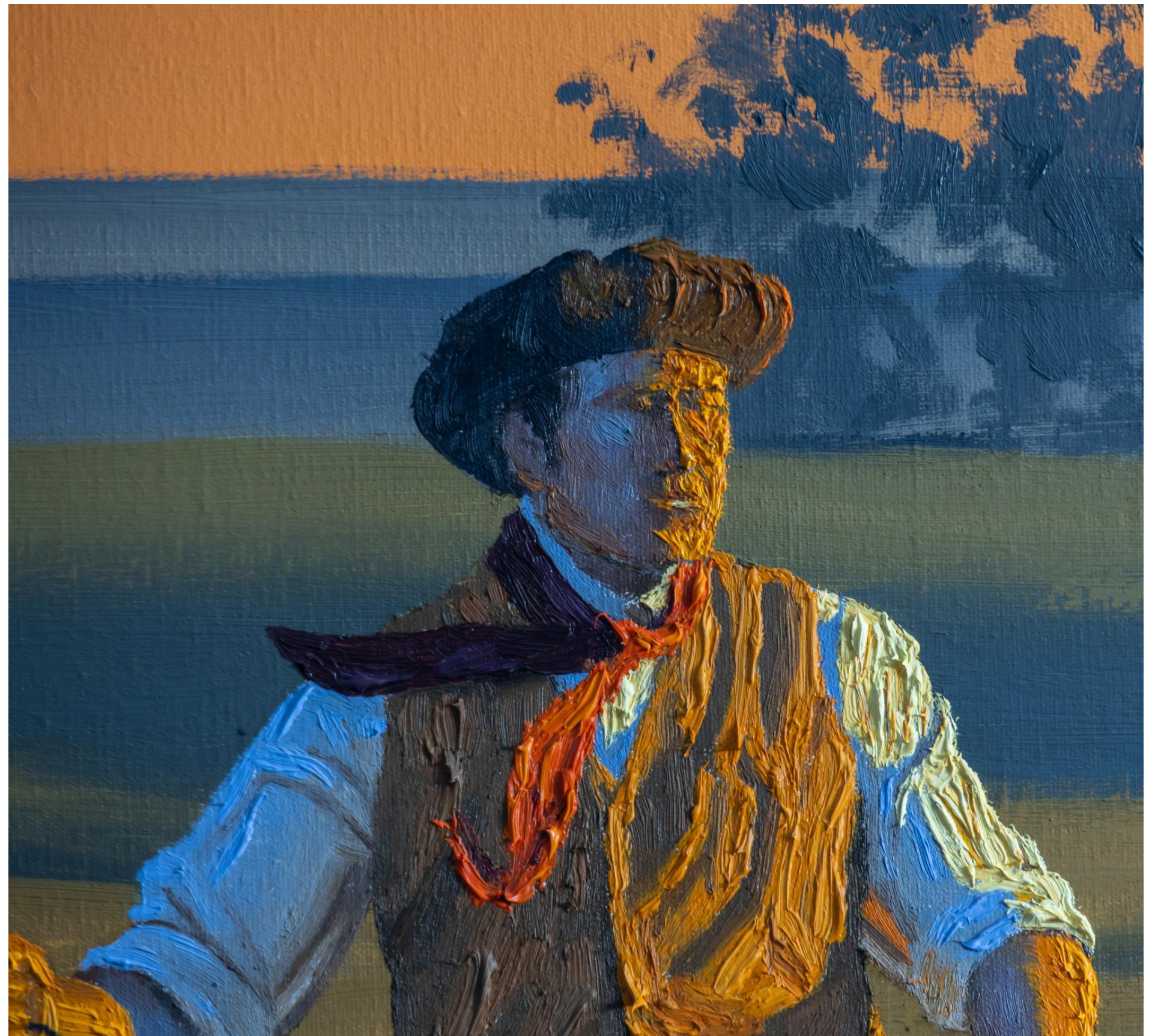
Detalhe da obra da página anterior