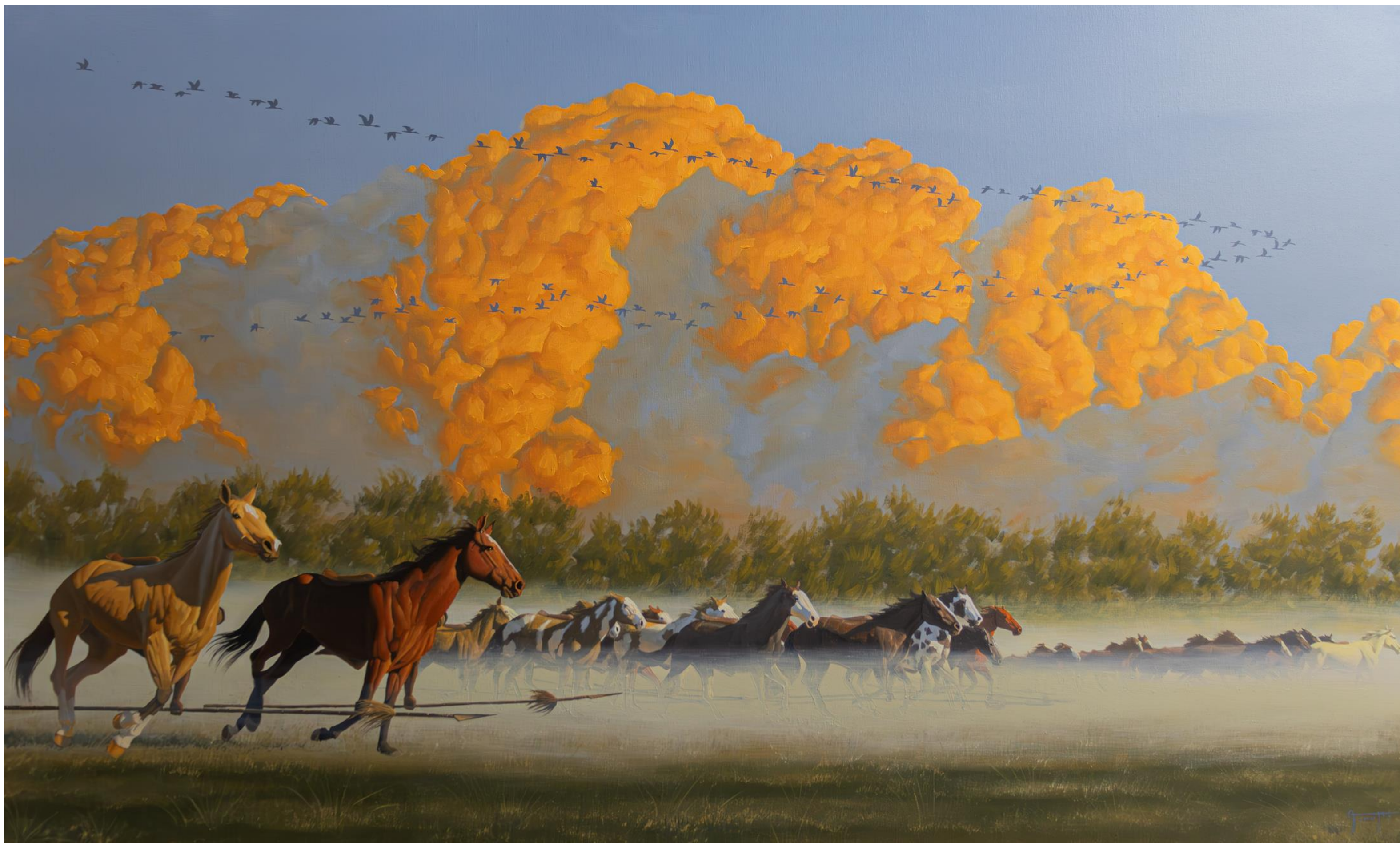
Alejandro Arnutti A MAJESTOSA NATUREZA VENHO SE EXIBIR OU SE VINGAR? 2025 [série O que restou dos Charrua? ] Óleo sobre tela, 90 x 150 cm