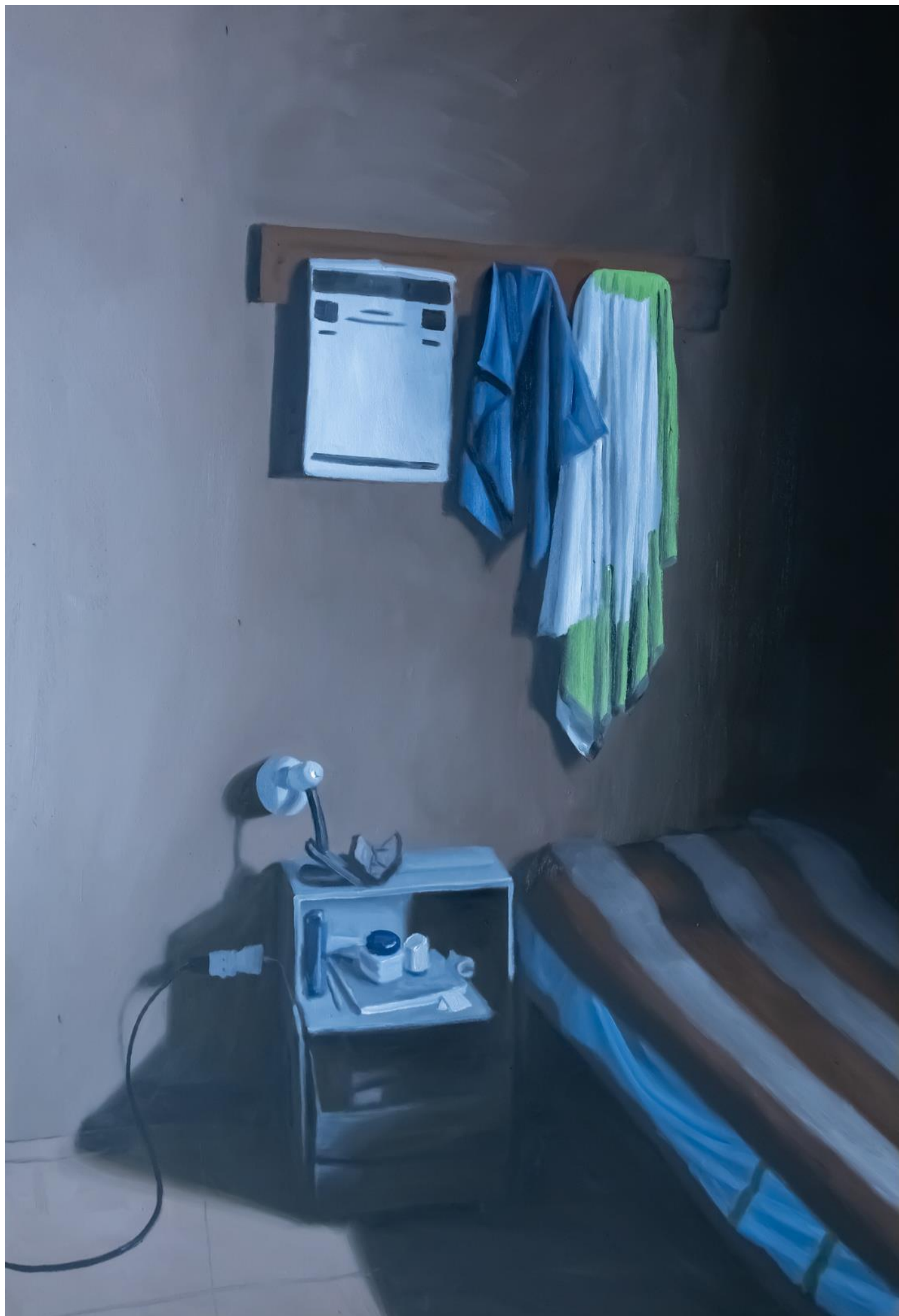
Alejandro Arnutti RECANTO SOLITÁRIO DE UM CAPATAZ , 2025 [série A solidão da imensidão ] Óleo sobre tela, 120 x 80 cm.