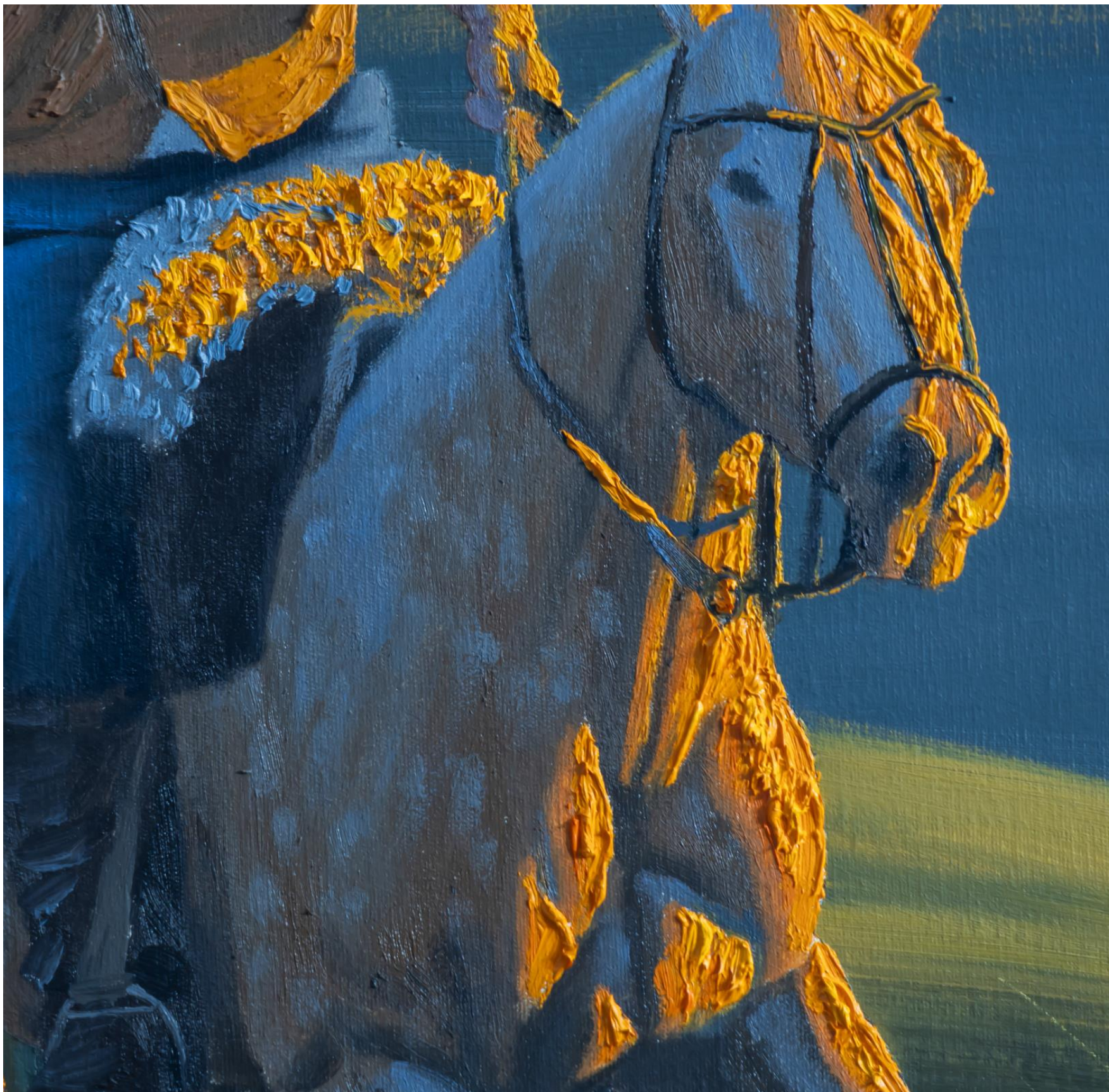
Detalhe da obra da página anterior