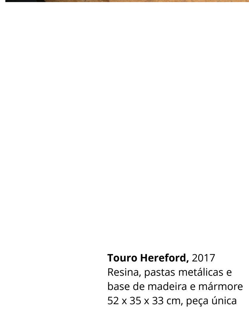
Touro Hereford, 2017 Resina, pastas metálicas e base de madeira e mármore 52 x 35 x 33 cm, peça única