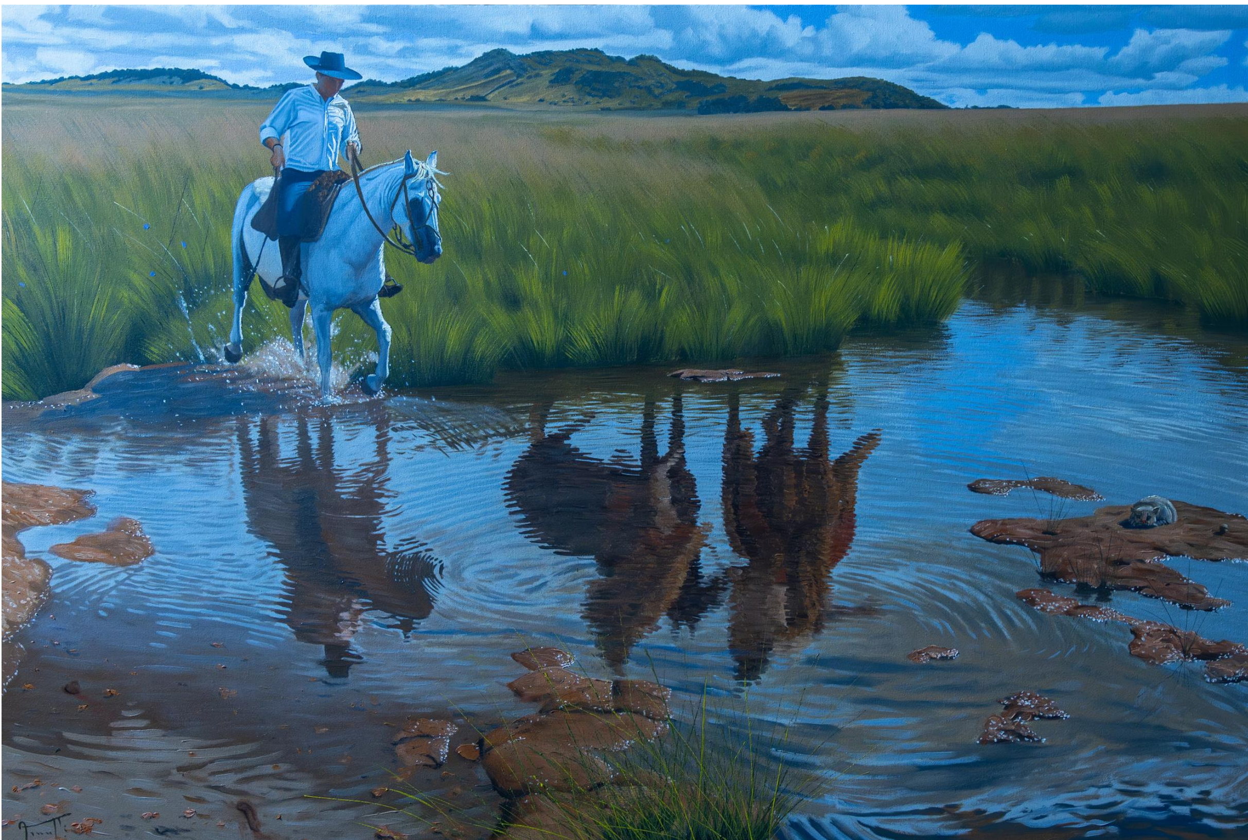
Alejandro Arnutti IMAGEM CAPTADA POR ARMADILHA FOTOGRÁFICA NO CERRO DO JARAU, 2024 óleo sobre tela, 60 x 90 cm Prêmio Aquisitivo no LXX Salão de Belas Artes de Piracicaba/SP

Na água, um eco: dois gaúchos refletidos, citação direta a Los Dos Caminos, de Juan Manuel Blanes — um convite silencioso a olhar para trás e reconhecer o que ainda resiste.